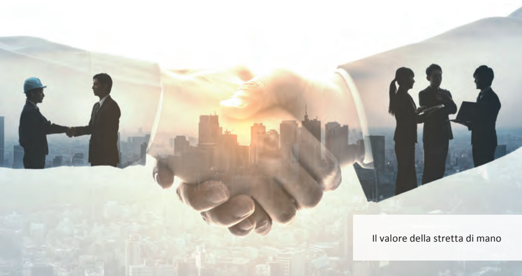
Il valore della stretta di mano

te / attese e comportamenti efficaci, grandinano critiche e se ci sono grandi discrepanze, si scivola nelle crisi più profonde.